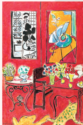
アンリ・マティス《赤の大きな室内》 1948年 ボンビドゥー・センター／ 国立近代美術館 Centre Pompidou, Paris, Musée national d'art moderne-Centre de création industrielle