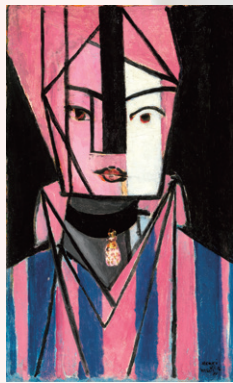
アンリ・マティス《白とバラ色の頭部》 1914年 ボンビドゥー・センター／ 国立近代美術館 Centre Pompidou, Paris, Musée national d'art moderne-Centre de création industrielle