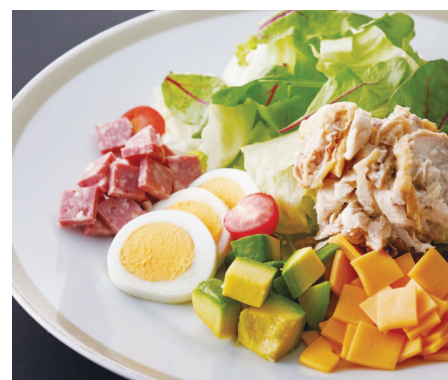
コブサラダ (スモールサイズ)