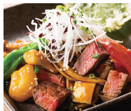
牛サイコロステーキと野菜の和風仕立て