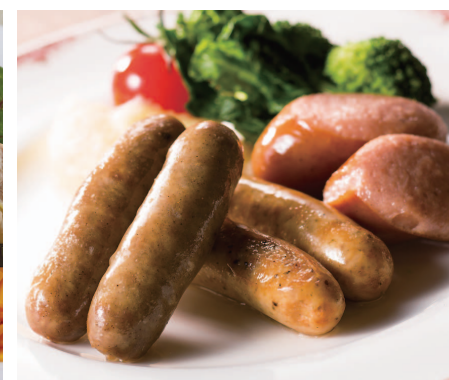
ソーセージソテー 温野菜添え