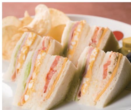
ミックスサンドイッチ