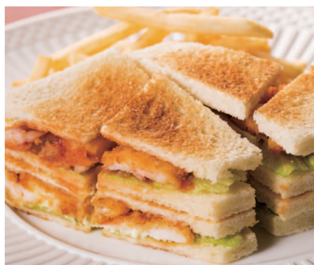
海老フライのサンドイッチ