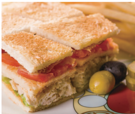
アメリカンクラブハウスサンドイッチ