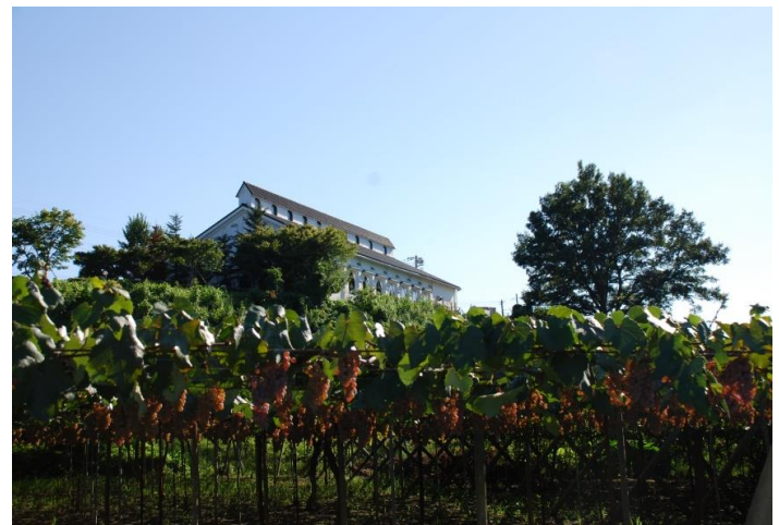
ぶどう畑からレストランテ風を望む

料金例: MIRAIを2名様でご利用の場合 136,000円 アルファードを4名様でご利用の場合 212,000円