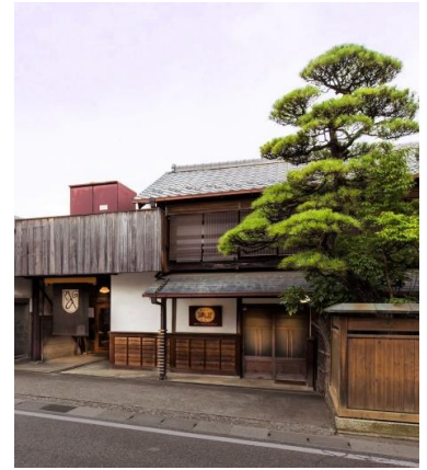
勝沼醸造株式会社 主屋

その中でも中心的なワイン産地である甲州市勝沼で、日本固有のぶどう種『甲州』に特化することで世界的な名声を得たワイナリー「勝沼醸造株式会社」を訪れ、『甲州ワイン』の奥深さ、勝沼地域の持つテロワールを肌で感じる事が出来る旅をご案内いたします。 ※テロワール:ワイン用ブドウの生育地の特徴を示すことば