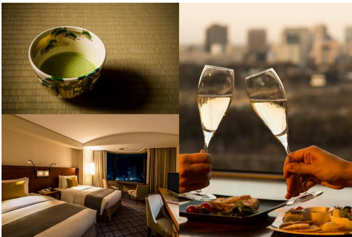
写真＝「レディースフライデープレミアム」イメージ