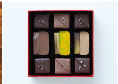
ボンボン・ショコラ「エスプリ」