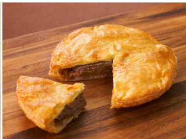
シャリアピンパイ