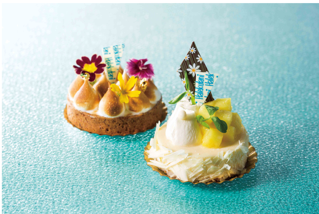
写真=ホテルショップ『ガルガンチュワ』(本館1階)で販売する新作スイーツ 「リリコイ メレンゲタルト」(左)「パイナップル チーズケーキ」(右)

パークサイドダイナー (本館1階) インペリアルラウンジ アクア (本館17階) ランデブーラウンジ・バー (本館1階) オールドインペリアルバー (本館中2階) ホテルショップ「ガルガンチュワ」 (本館1階)