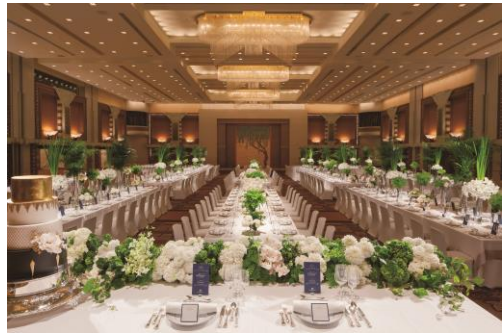
【晚餐会スタイル イメージ】