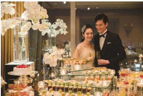
【ブフェスタイル イメージ】

今回の新商品では、ブフェスタイルや晚餐会スタイルなど新たなウエディングスタイルのご提案や上質な空間で華やかなレセプションが叶うプラン、ご家族や大切な方々とゆったりとお過ごしいただけるプライベートプランなどおふたりらしいウエディングをかたちにする多彩なウエディングプランをご用意し、多様化する婚礼ニーズに幅広く対応いたします。