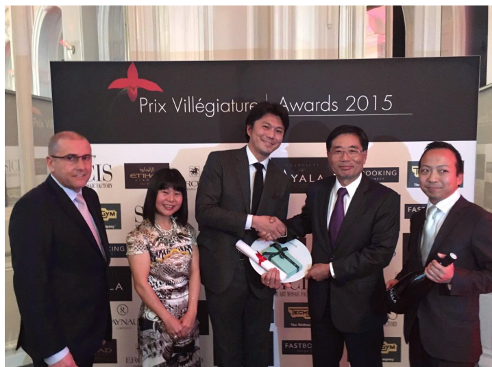
「プリ・ヴィレジアトゥール(Prix Villégiature)」授賞式の様子 右から3番目が帝国ホテル東京の受賞代表者