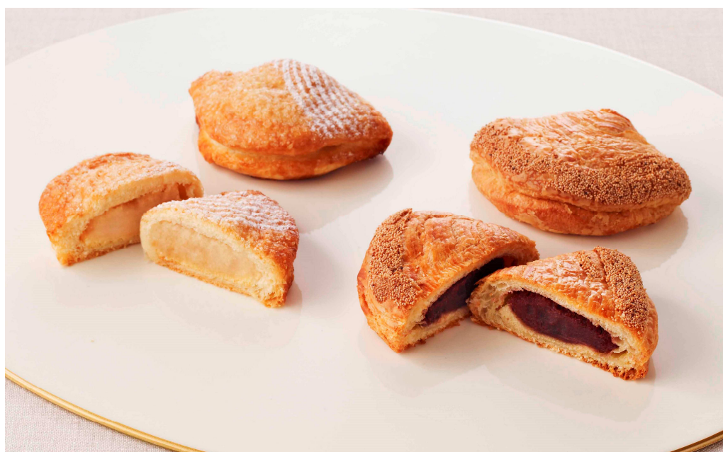
写真＝「とらや」製の餡が入った『帝国ホテル 特製あんぱん-夏-』

販売場所：本館1階 ホテルショップ「ガルガンチュワ」 本館地下1階 「とらや 帝国ホテル店」