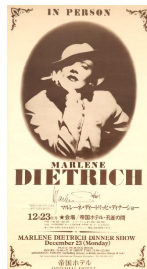
孔雀の間で開催されたマレーネ・ディートリッヒディナーショーのポスター (1974年)

お問い合わせ : ホテル事業統括部営業企画課 TEL. 03-3539-8240 受付時間 月～金 10:00～17:00