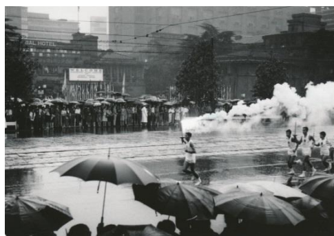
東京オリンピック 帝国ホテル前を走る 聖火ランナー (1964年)