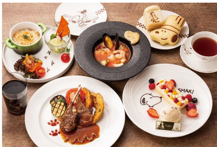
左：『PEANUTS』のキャラクターやストーリーをちりばめた「PEANUTS Friends' Afternoon Tea」 右：シュルツ氏へのオマージュを込めた「料理長スヌーピーのレストランプラン 10th story」