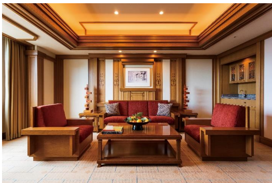
「フランク・ロイド・ライト®スイート」リビングルーム