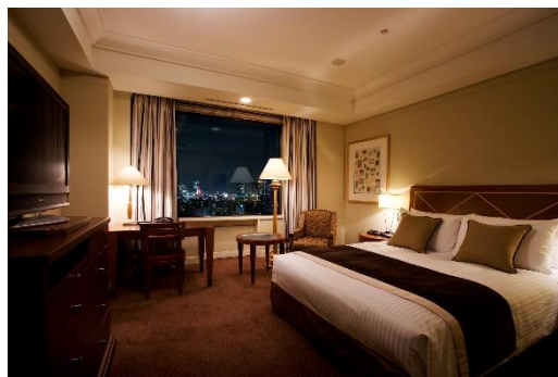
レギュラーフロア スタンダード(30㎡)

TEL.(06)6881-4100(月～土9時～18時30分/日・祝日9時～17時30分)