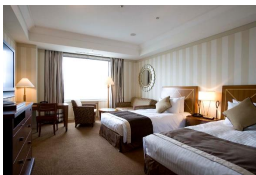
レギュラーフロア スーペリア(40㎡)