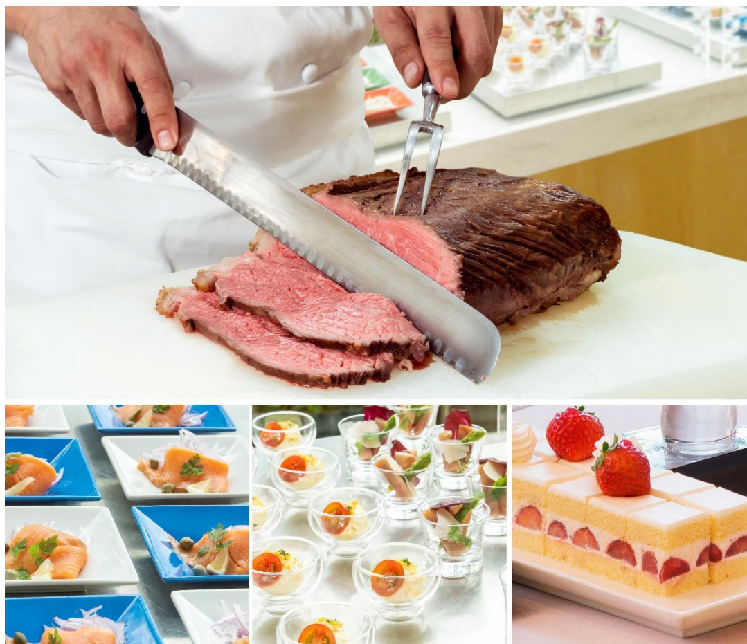
ワゴンサービスのローストビーフ、バイキング (イメージ)