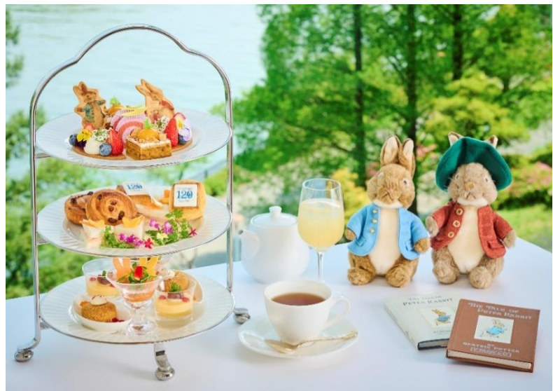
左：ピーターラビット™絵本出版120周年記念 帝国ホテルオリジナルアート 右：絵本の世界を堪能できるアフタヌーンティー（ティースタンドは2名分）