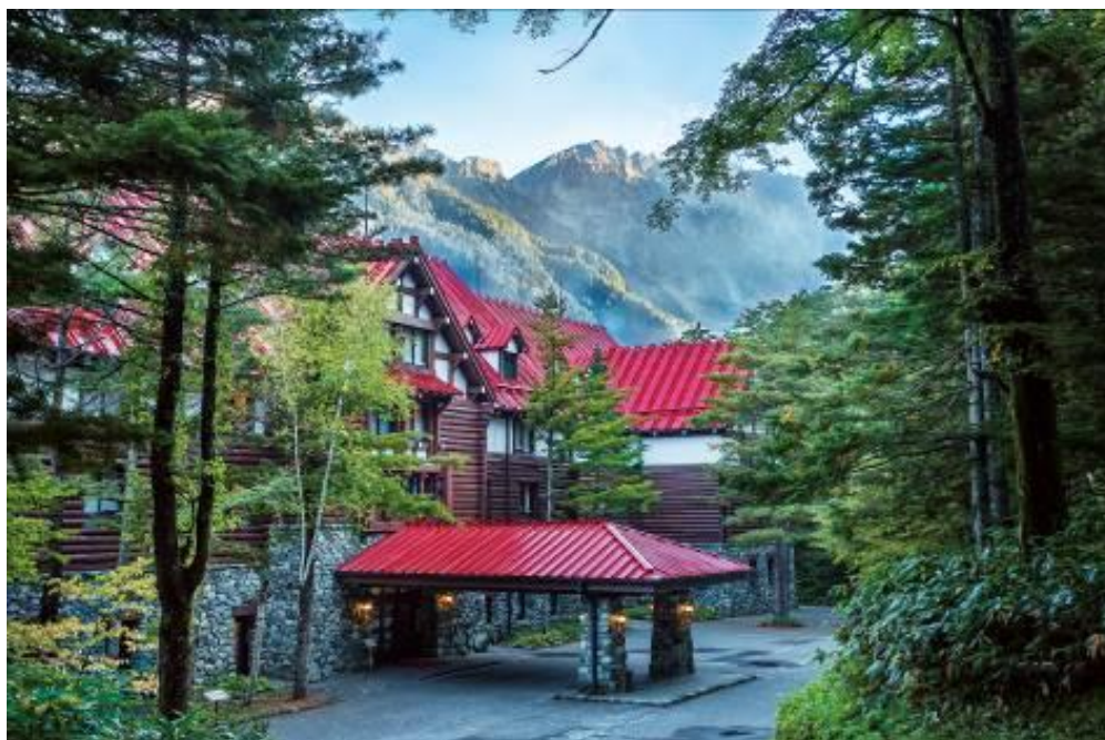
2023 年に開業 90 周年を迎える上高地帝国ホテル