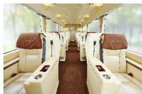
ロイヤルロード・プレミアム(車内)