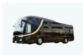
ロイヤルロード・プレミアム(外観)

JTB ロイヤルロード銀座 本店 国内旅行デスク TEL:0120-262-115 (10:00～18:00 祝日・振替休日・国民の休日・年末年始除く)