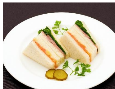
ミックスサンドイッチ