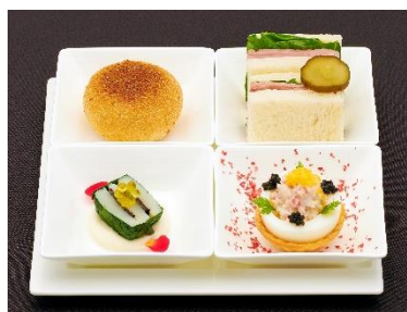
アフタヌーン プレート