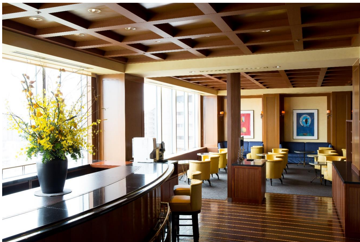
インペリアルフロア ラウンジ

コロナ禍の自粛生活で自分や大切な人への「ご褒美消費」が拡大 新たな宿泊特典で、ゆとりのある贅沢な宿泊体験を インペリアルフロア客室およびスイートの 新たな宿泊特典を開始 新宿泊者ラウンジ「インペリアルフロア ラウンジ」も同日開設 2021年10月1日(金)から