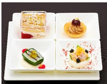
イブニング プレート