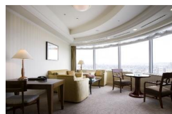
レギュラーフロア スイート(100㎡)