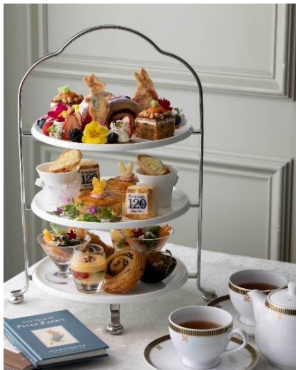
左：ピーターラビット™絵本出版120周年記念 帝国ホテルオリジナルアート 右：絵本の世界を堪能できるアフタヌーンティー