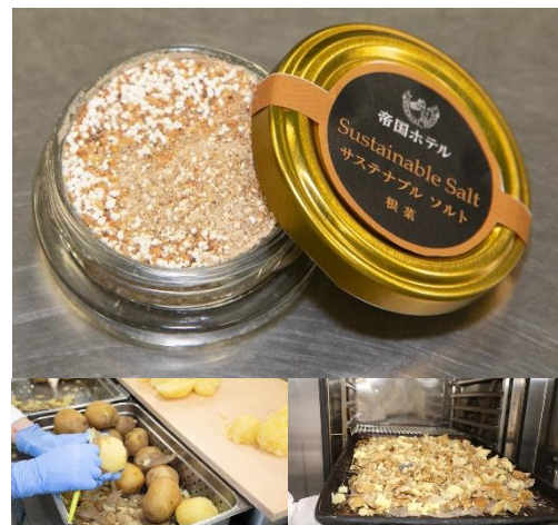
上：サステナブルソルト 根菜 下：制作過程

なお、本商品の売上の一部を、環境保護を推進する一般社団法人 JEAN へ寄付いたします。