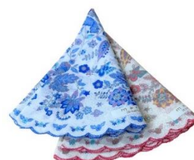
更紗 maru ハンカチ

お問い合わせ先 帝国ホテルプラザ 大阪 TEL. (06) 6881-1100 受付時間 平日 10:00～17:00