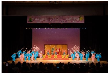
大きなホールでの生活発表会