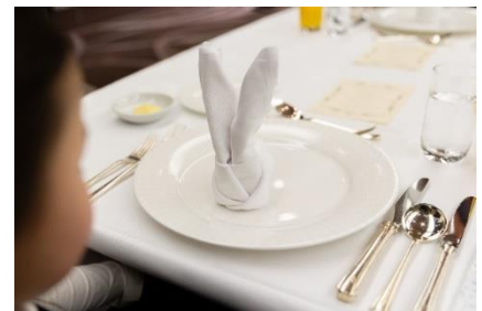
ホテルでのテーブルマナー講習