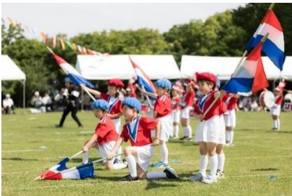
芝生の公園での運動会