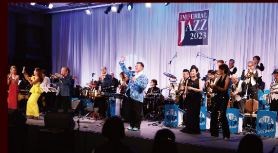
インペリアルジャズ2023 東京会場の様子