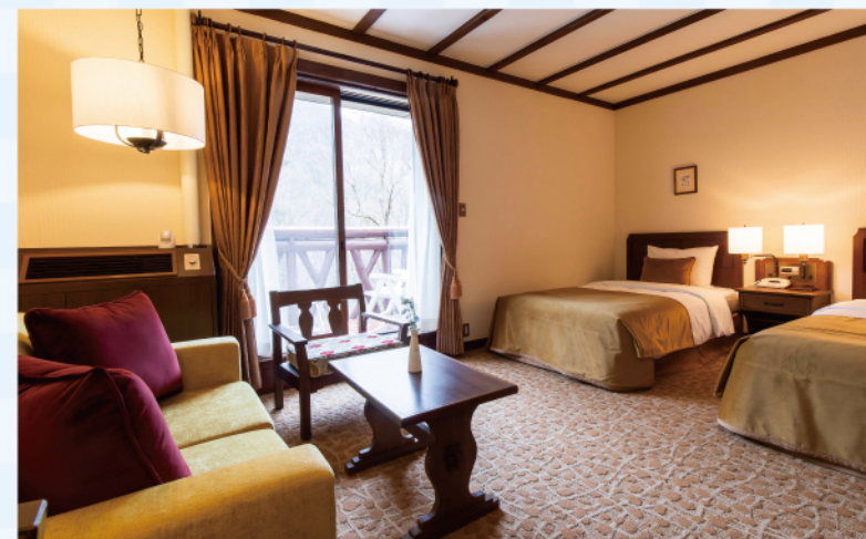
ベランダ付ツイン