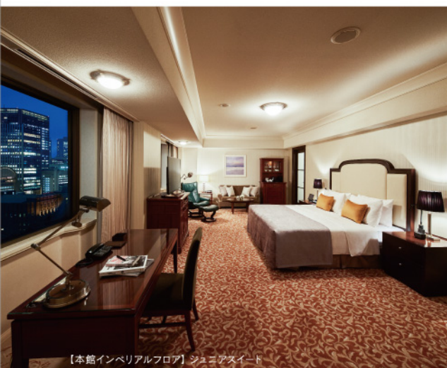
【本館インペリアルフロア】ジュニアスイート

ご予約・お問い合わせ | 帝国ホテル 東京 客室予約係 Imperial Hotel, Tokyo Room Reservations TEL. (03) 3504-1251 インベリアルクラブ 0120-115489