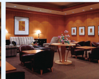
ザクラブルーム 大阪

資料請求・お問い合わせ | ザクラブルーム 東京 / TEL.(03)3539-8061 ザクラブルーム 大阪 / TEL.(06)6881-4890