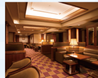
ザクラブルーム 東京

※消費税込、入会金不要。 ※ご同行の方のご利用は、20歳以上のお客様に限りです。