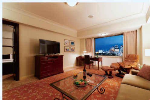
【本館インペリアルフロア】デラックススイート