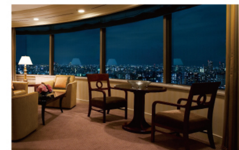
レギュラーフロア パークスイート

ご予約・お問い合わせ | 帝国ホテル 大阪 客室予約係 Imperial Hotel, Osaka Room Reservations TEL. (06) 6881-4100 インペリアルクラブ 0120-548978