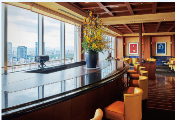
インペリアルフロア ラウンジ

「インペリアルフロア ラウンジ」では豊富なドリンクのほか、帝国ホテルならではのプレートメニューをご提供いたします。