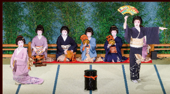
第13回東西おどり(2023年)

ご予約・お問い合わせ | 帝国ホテル 東京 サービスアパートメント予約担当 / TEL. (03) 3539-8519 インペリアルクラブ 0120-115489 Serviced Apartment Reservation / TEL. (03) 3539-8519