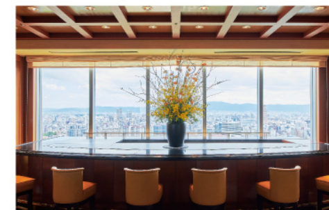
インペリアルフロア ラウンジ