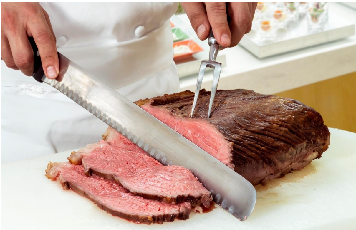
シェフが目の前で切り分けるローストビーフ(イメージ)