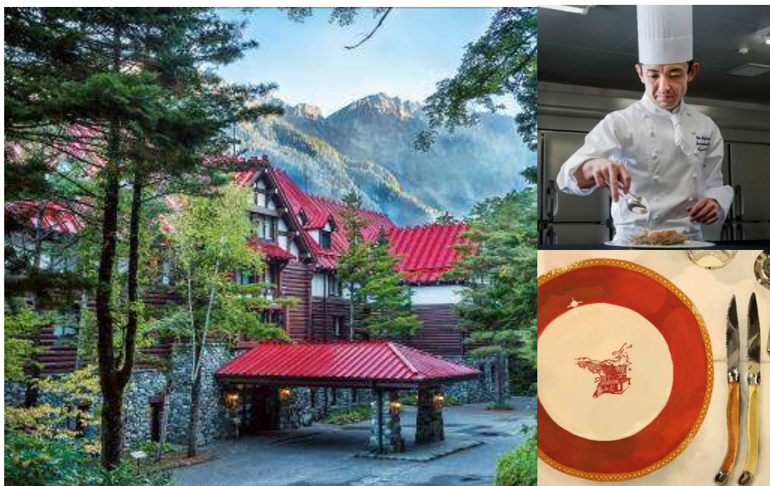
（左）上高地帝国ホテル