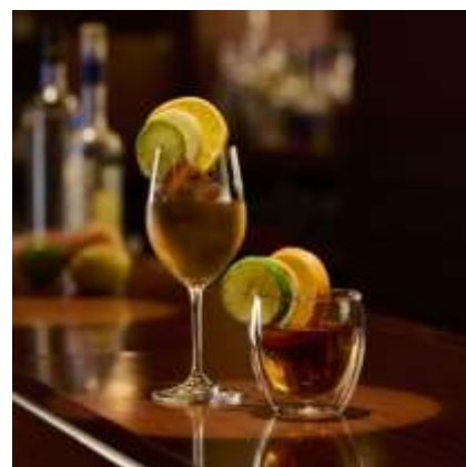
ノスタルジア 左：アイス、右：ホット

レモンバーベナと柑橘の甘くすっきりとした味わいで、アイス・ホットのどちらでもお楽しみいただけます。