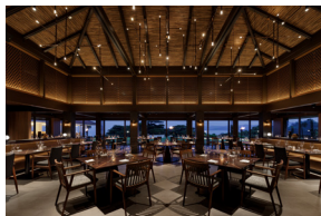
The Steak & Grill

小浜島や沖縄県産の食材を織り交ぜ、洋食・和食・沖縄スタイルにアレンジしたビュッフェレストラン。