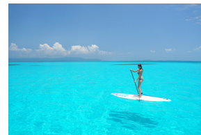
SUP(スタンドアップパドル)

八重山の海を知りつくしたガイドがコンディションに合わせてベストポイントへご案内します。初心者コースから上級者コースまで、熟練度に合わせてコースを選択いただけます。