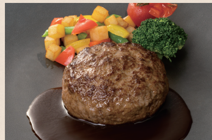
近江牛ハンバーグステーキ

トッピング (目玉焼き) + 400円 with fried egg for an additional 400 yen