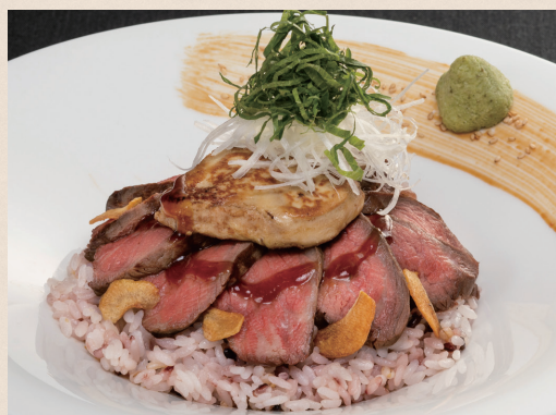
牛フィレ肉と十穀米のテリヤキステーキピラフ フォアグラソテーのせ

Macaroni Gratin with Chicken, Shrimp and Ham