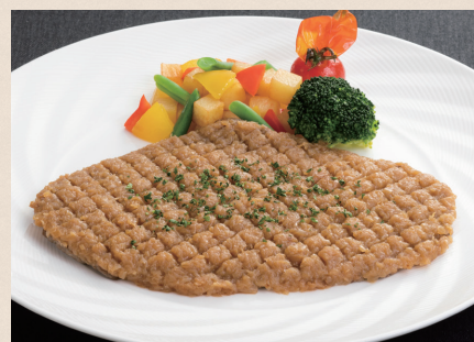
シャリアピンステーキ

帝国ホテル発祥のシャリアピンステーキ ..... ¥4,300 Original Imperial Hotel Chaliapin Steak