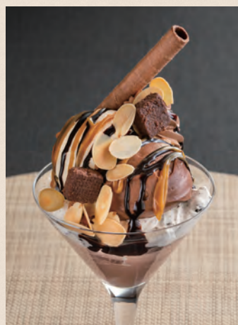
チョコレートパフェ