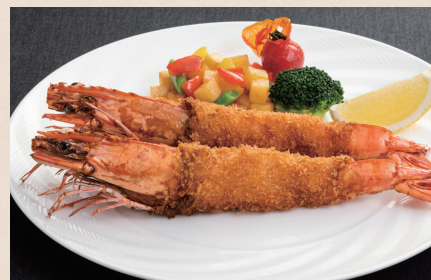
有頭海老のフライ タルタルソース レモン添え

有頭海老のフライ タルタルソース レモン添え ..... 3,200 Fried Prawns with Tartar Sauce and Lemon