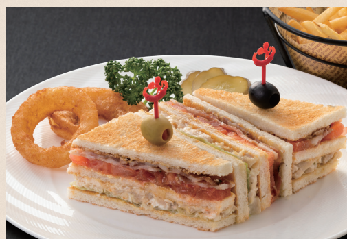
アメリカンクラブハウスサンドイッチ