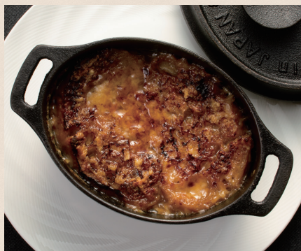
オニオングラタンスープ

オニオングラタンスープ ..... 1,600 Onion Gratin Soup