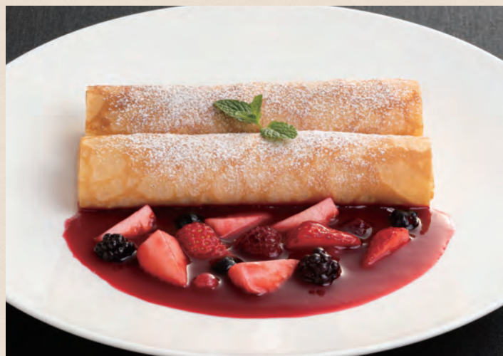
カッターチーズ入りクレープ レッドベリーソース