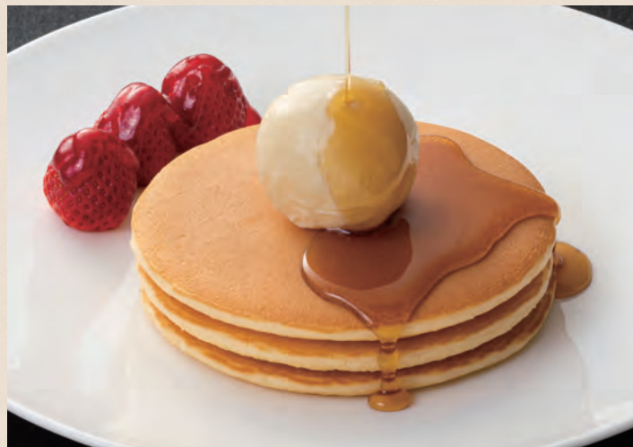
インペリアルパンケーキ いちご添え