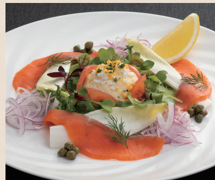
スモークサーモンとポテトサラダの盛り合わせ