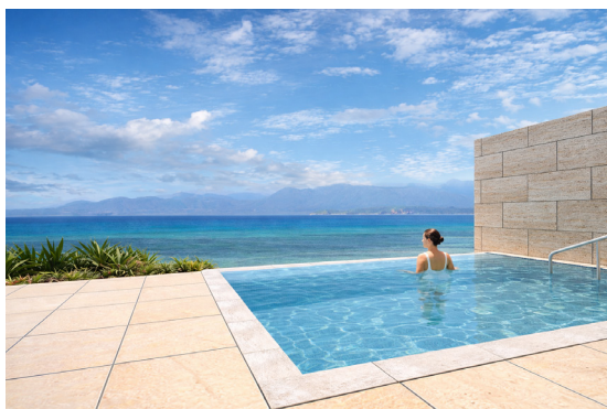
冷却・昇温機能付きのプライベートプール