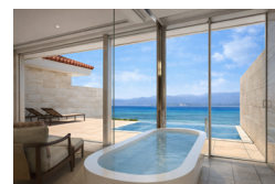
開放的な眺望のバスルーム