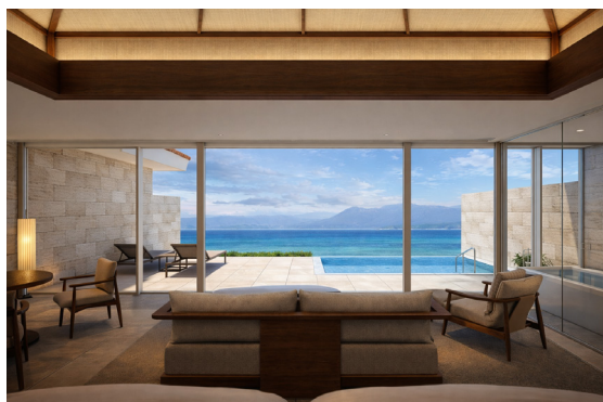
全室オーシャンビューの眺望