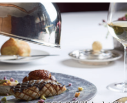
フランス料理 レセプション

※入会金無料で、UC(VisaまたはMasterCard)提携の会員証を発行いたします。 ※個人名義でのご入会となりますが、お申し込み人が法人代表者様の場合は、引き落とし口座を法人口座でもご登録いただけます。