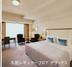
本館レギュラーフロア デラックス

インペリアルクラブは、日本のホテル会員組織の草分けとして1973年に発足以来、各界でご活躍の多くの方々にご入会いただき、ビジネス、プライベートを問わず様々な場面で上質なサービスと多彩な特典をお楽しみいただいております。