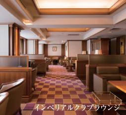
インペリアルクラブラウンジ