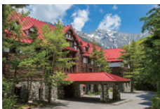
上高地帝国ホテル