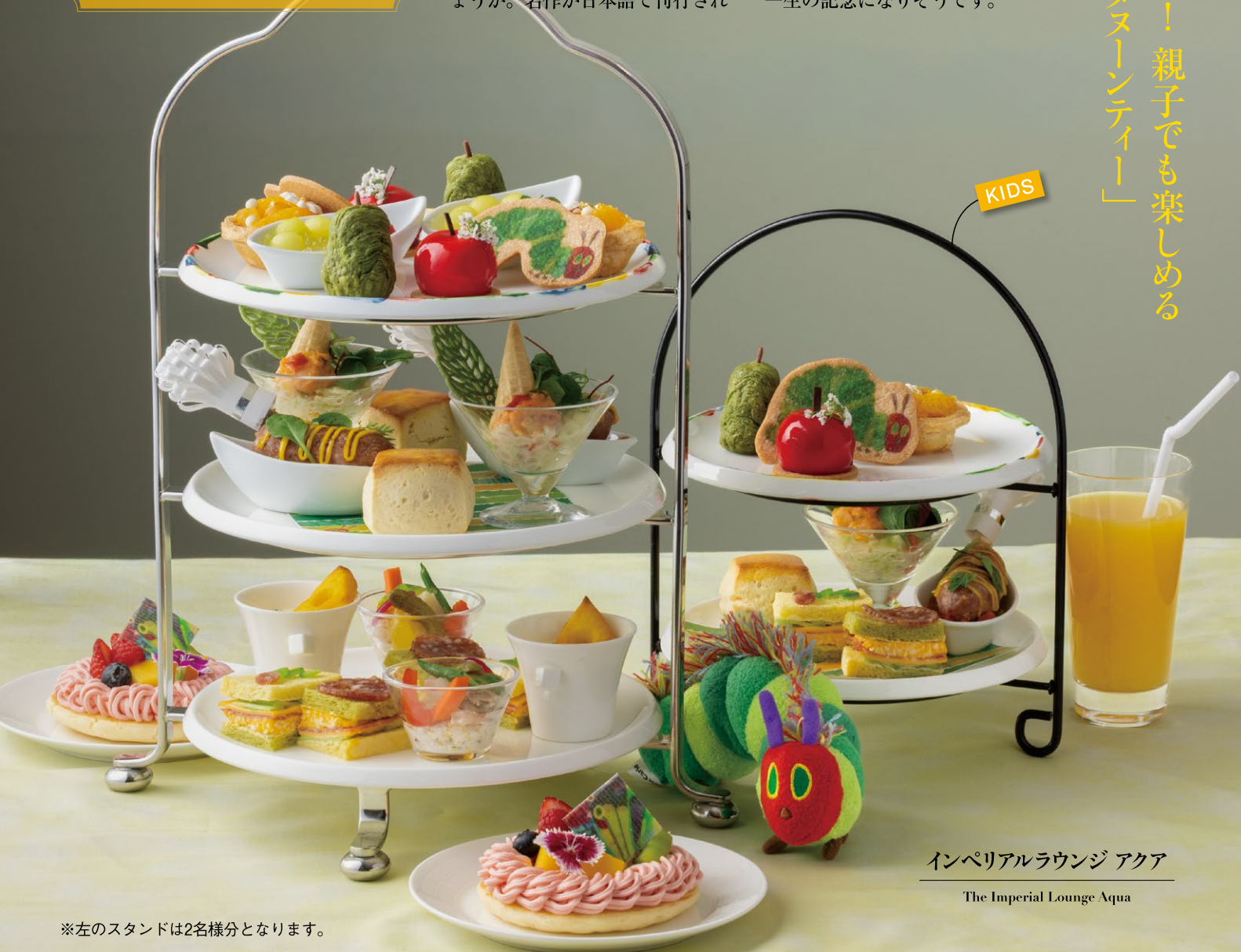
インペリアルラウンジ アクア The Imperial Lounge Aqua