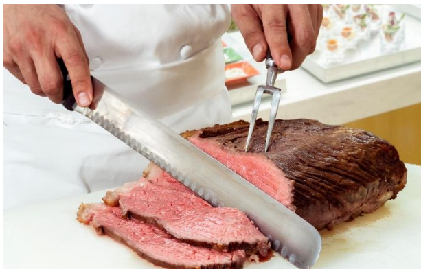
(左上・左下) ご自身でお作りいただけるハンバーガー、ミニパフェ (右上) 綿あめ、(右下) ローストビーフ